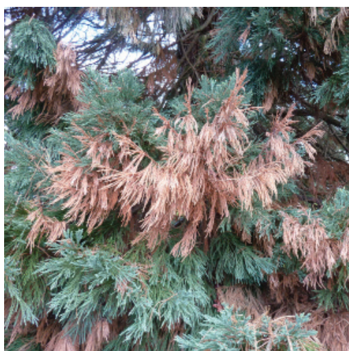
Figure 4 Brunissement des rameaux atteints.