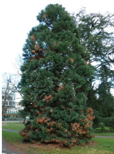
Figure 2 Atteintes éparses de la couronne d'un séquoia géant.