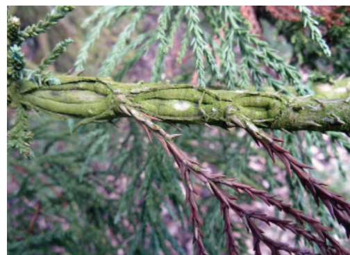
Figure 6 Nécroses sur branche.