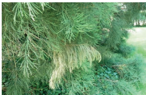
Figure 3 Décoloration verte claire des rameaux contrastant avec le vert sombre habituel.