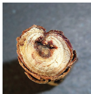
Figure 8 Coupe transversale d'une branche atteinte, avec nécrose imbibée de résine.