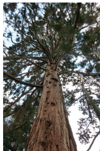
Figure 5 La couronne de l'arbre, élaguée naturellement de ses rameaux secs, apparaît clairsemée.